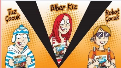
Kistik Fibrozis hastası Tuz Çocuk, üstün koku alma gücüyle tüm sorunların üstesinden gelen Sistinosis hastası Biber Kız ve gelecekte gelen teknolojiyle Duchenne Musküler Distrofi hastası Robot Çocuk maceradan maceraya koşuyor.