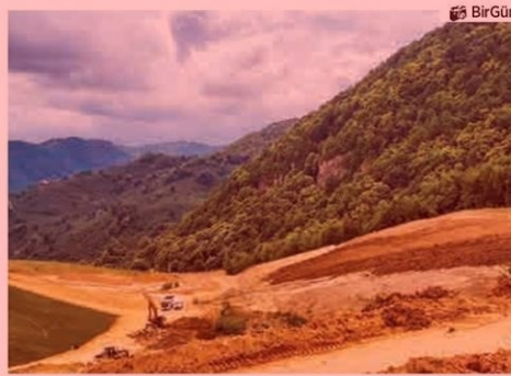
Fatsa'da gerçekleştirilen ağaç katliamı böyle görüldü.

Fatsa'ya çullaniyor. Bu Fatsa'ya hakaret. Bu haksızlığı önlemek için defalarca öneriler verdik. Bakanlık, genel müdürlük yerel yetkililer. Burada çok açık bir şekilde yerel orman işletme yetkilileri suç işliyor. Millet adına devlet adına görev yapan yetkililer altın şirketine taşeronluk yapıyor. Oldu bitti ile katliam yapıyor." ■ Haber Merkezi